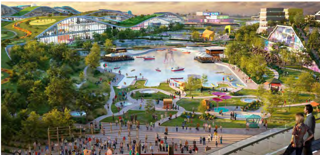
Vue d'artiste du projet EuropaCity © Alliages et territoires