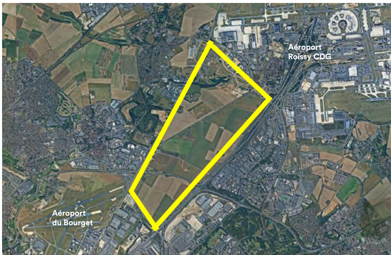
Le "triangle de Gonesse" sur la photo satellite.

Ministre de l'Écologie du gouvernement d'Edouard Philippe